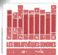
Table ronde : Personnes aveugles et malvoyantes, comment adapter votre quotidien ?

Venez nous rencontrer le vendredi 30 juin à GUIPAVAS de 9h à 16h30 Maison de Quartier de Coataudon Rue François Villon 29490 GUIPAVAS