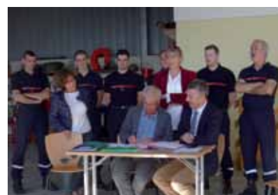
Signature de la convention