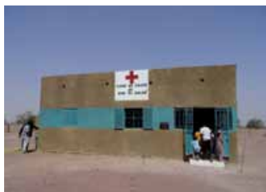
Case de la santé