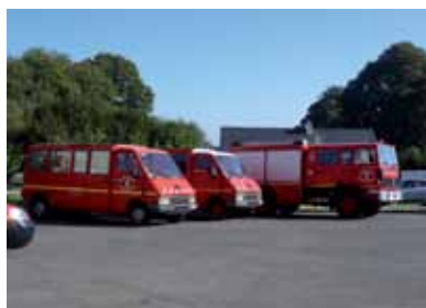
3 véhicules déclassés du SDIS 29